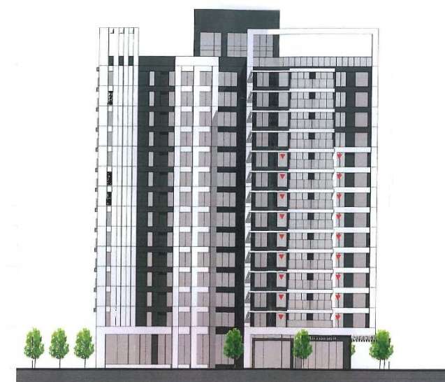
重建後模擬示意圖