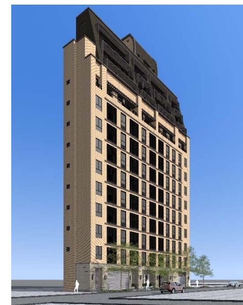
重建後模擬示意圖