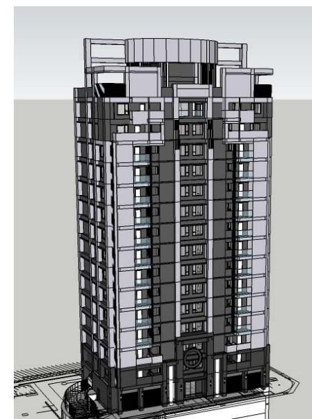
重建後模擬示意圖