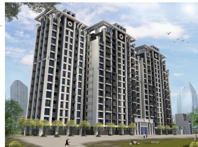
重建後模擬示意圖