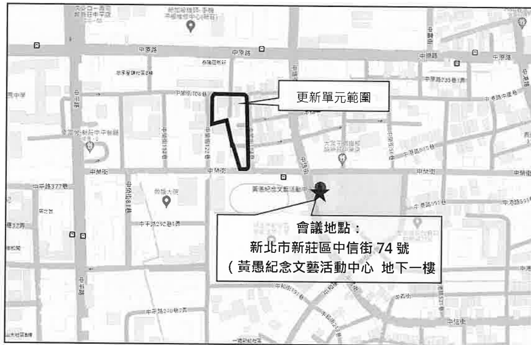
圖 2 開會地點示意圖